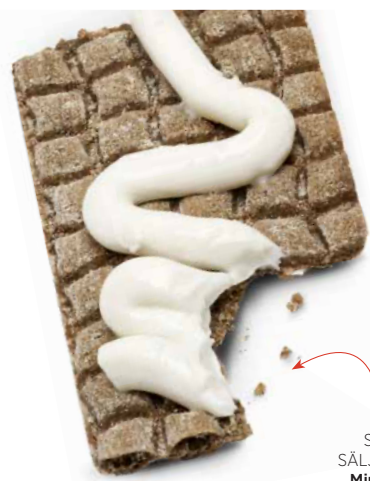
STOR-SÄLJARE. Mjukost på tub.