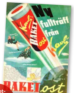
Raketosten tillverkades 1947-1979.